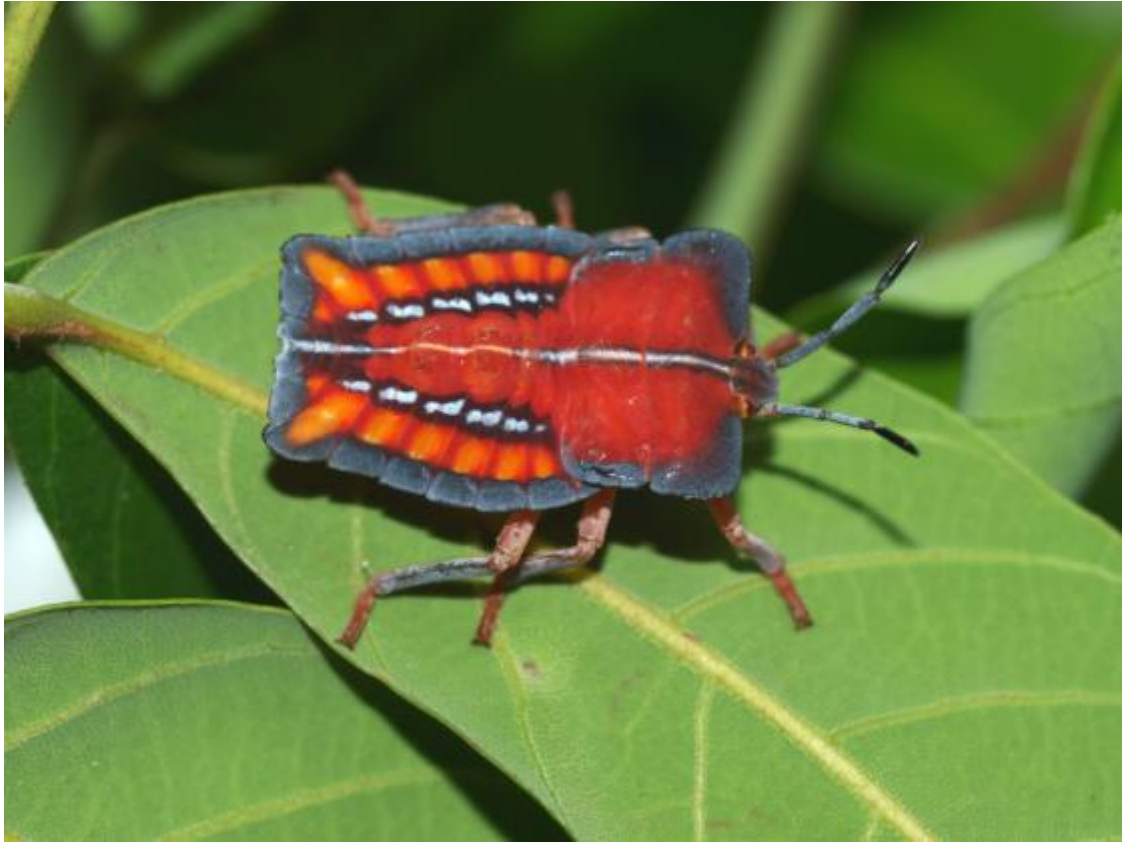
荔枝椿象若蟲體色鮮艷，卻能噴出毒液灼傷人體。