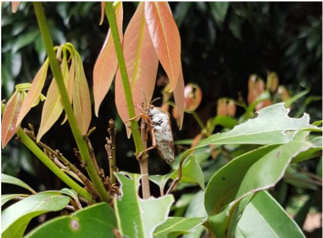
荔枝椿象成蟲於荔枝嫩芽上取食為害。