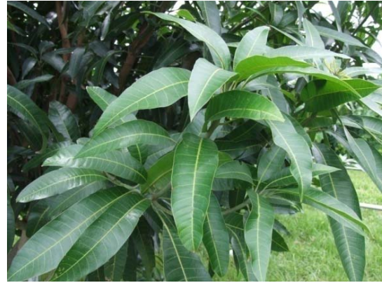
圖三、芒果‘臺中1號’葉片與枝條外觀 Fig. 3. Leaves and shoots of ‘Taichung No. 1’ mango