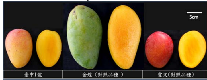
圖五、芒果‘臺中1號’、金煌與愛文的果實外觀及果肉色澤比較