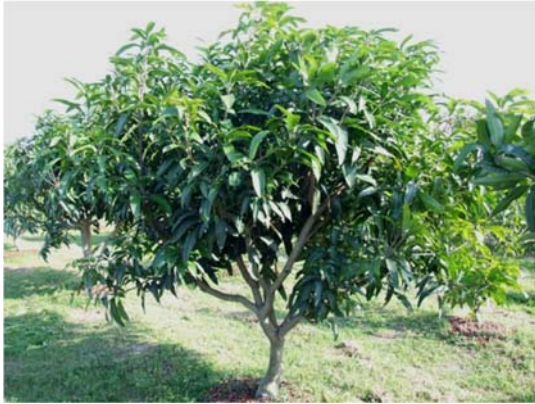
圖二、芒果‘臺中1號’植株外觀 Fig. 2. Plant appearance of ‘Taichung No. 1’ mango