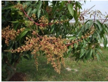
圖四、芒果‘臺中1號’花序形態與外觀