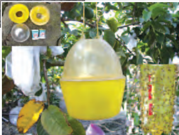
▶圖4 果實蠅誘引防治資材吊掛防治情形