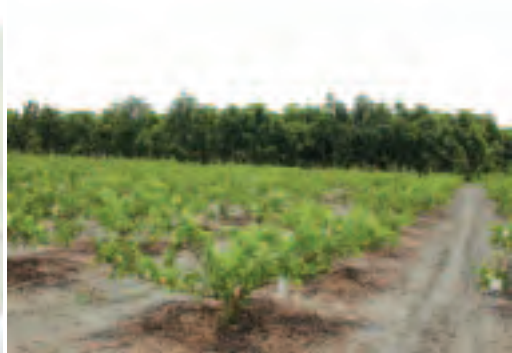
▲圖1 整潔的果園是生產優質果實的先決條件

於95及96年為了加強推廣台中地區番石榴果農實施產銷履歷之理念及意願，本場番石榴工作小組同仁配合「推動番石榴產業整體發展計畫」之執行，於區內主要番石榴