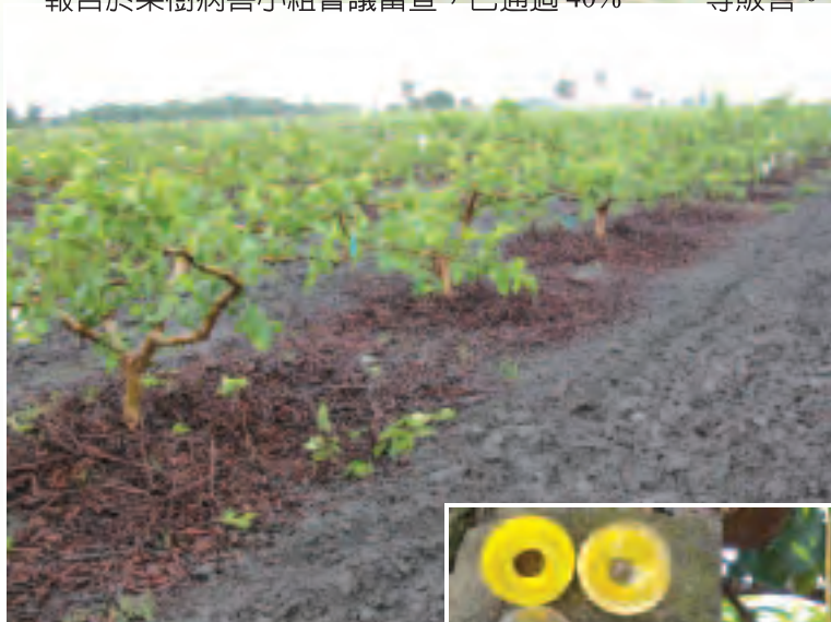
◀圖3 有機質及化學肥料施用後以機械翻耕

96年底至97年初台中地區通過產銷履歷驗證的番石榴產銷班，共有6個產銷班（13人），生產面積為9.5公頃（如一覽表所示），並已有產品貼上條碼標籤供應超市等販售。