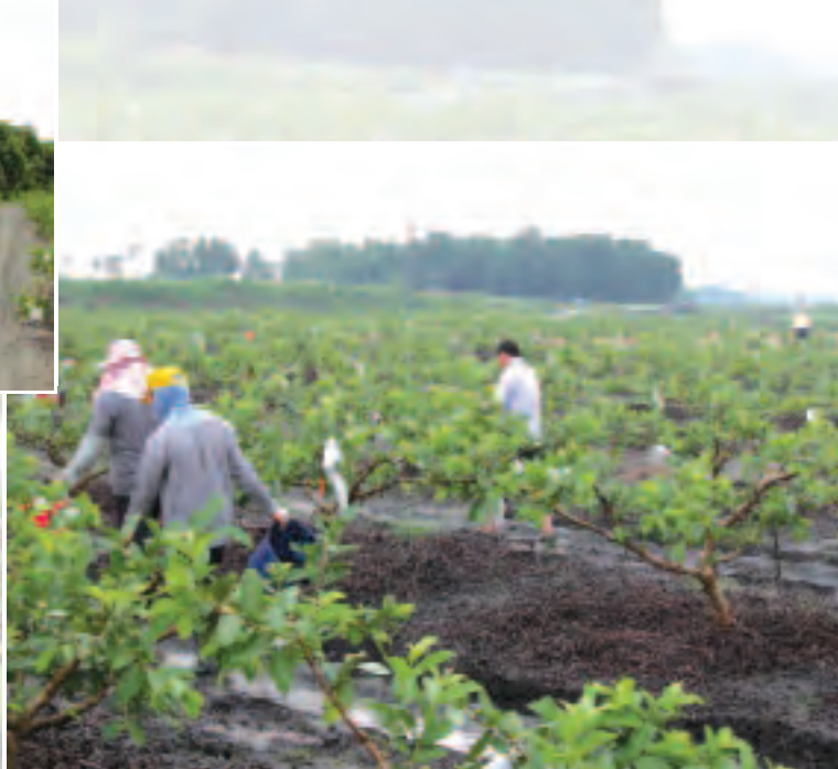
►圖2 合理化施肥改善果園地力並促使植株生育均衡發展