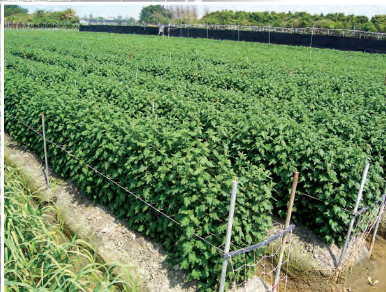
▲露天栽培之菊花施肥後培土覆蓋，以避免肥料揮發及流失 －合理化施肥之植株生長良好