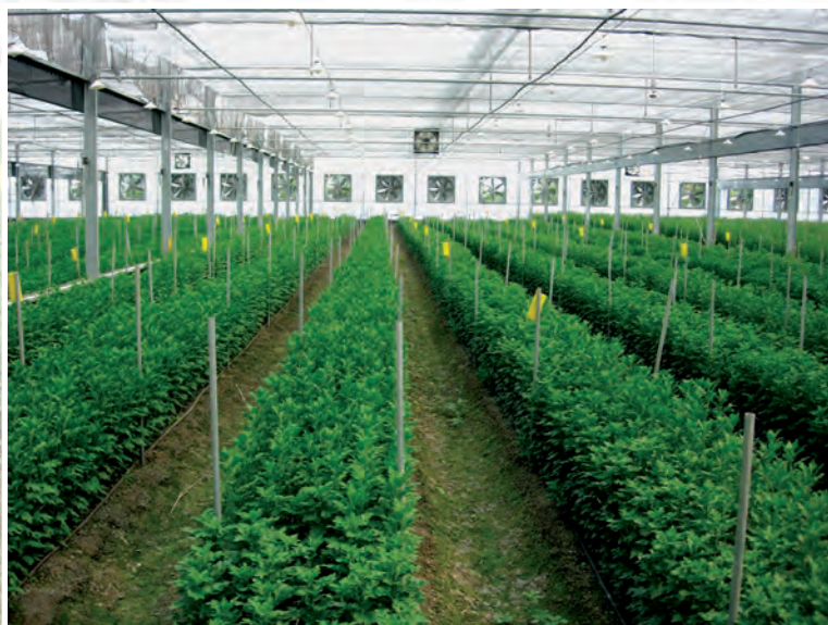
▲菊花溫室內以液肥滴灌合理化施肥之範例－植株生長良好一致

栽種菊花的合理施肥推薦用量，每一期作有機質肥料每公頃施用約 6-10 公噸，化學