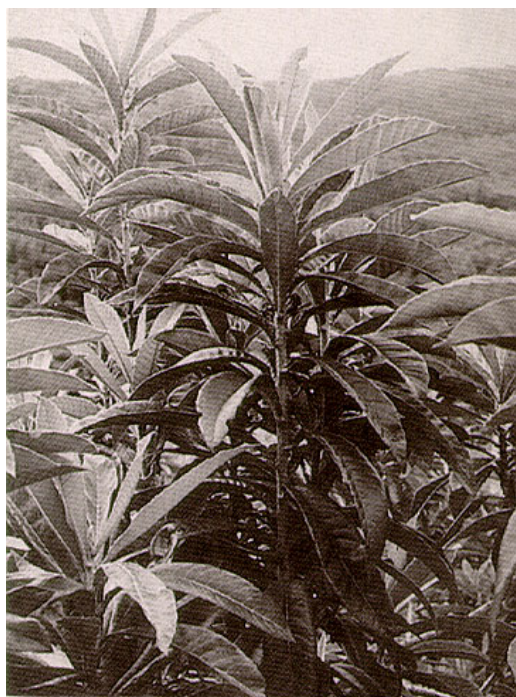
圖一.生育強壯之枝條往往不易形成結果母枝，亟需合理化之土壤施肥與葉面肥培，才能提高結果枝率。