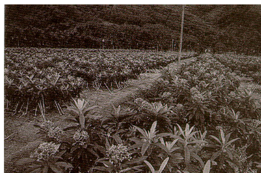
圖四.枇杷園草生栽培是穩定果園物候相之重要條件之一。