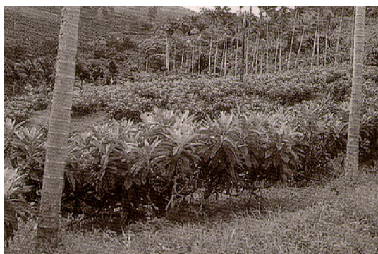
圖三.不同肥培處理在同一種植區之花期能產生明顯差異。