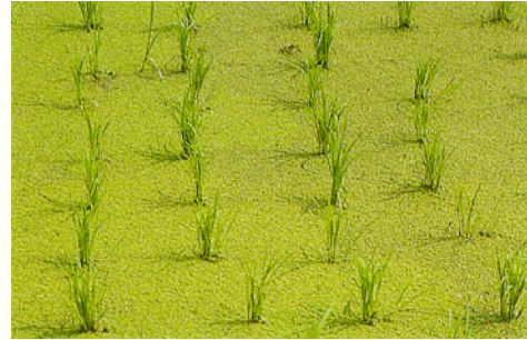
圖四、滿江紅放植 10~15 天後增殖覆蓋田面情形。