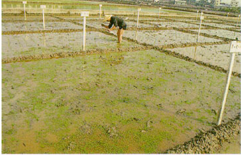
圖二、水稻插秧後即放植滿江紅撒播於稻田。