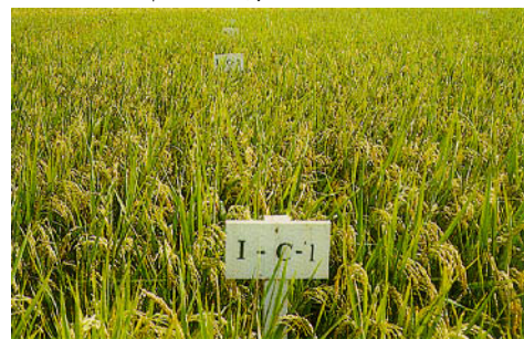
圖七、放植滿江紅之水稻成熟情形。