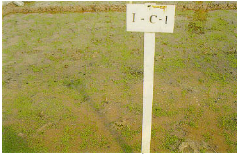
圖三、試驗放植 100g/m 2 滿江紅植體量。