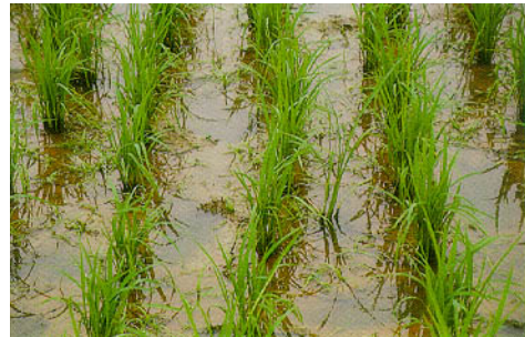
圖六、對照(未放植滿江紅)水稻田 20~25 天雜草滋生情形。