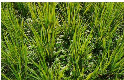
圖六、對照(未放植滿江紅)水稻田 40~45 天雜草滋生情形。