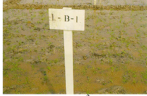
圖三、試區放植 50g/m 2 滿江紅植體量。