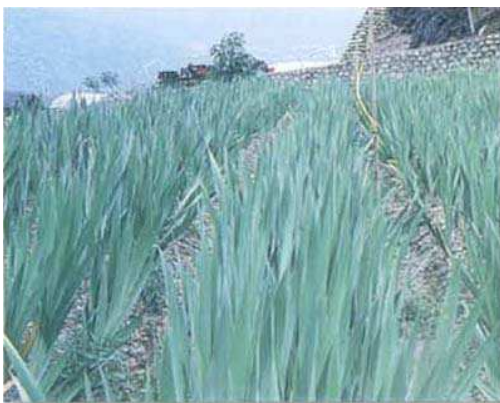
↑圖五、利用高冷地進行宿根栽培唐菖蒲