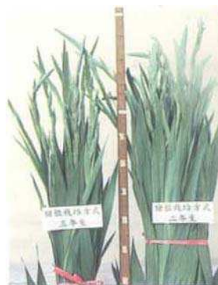
↑圖六、宿根栽培方式所生產切花。