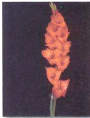
↑圖四、唐菖蒲利用夜間電照可增長花莖、花苞數，提高切花品質。