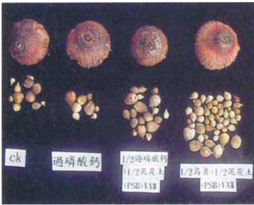
↑圖三、利用有機植肥料及微生物，增加種球繁殖。