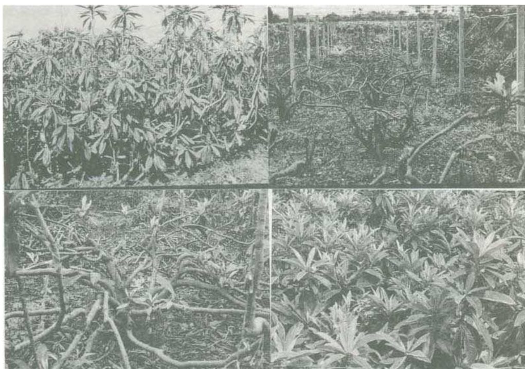
圖1 枇杷更新修剪程度與新梢生育情形 上左：更新修剪前枝幹密佈樹型雜亂 上右：留高主幹（60cm）去除主枝末端的更新修剪 下左：更新修剪留主幹高度在45cm高，末端不修剪 下右：更新修剪後至9月下旬之新梢生育與花穗形成情形