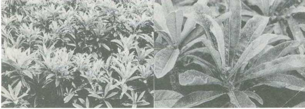
圖3 更新修剪後新梢生長旺盛（左）； 在5~7月間噴施第一磷酸鉀後可抑制生長提高花芽率（右）