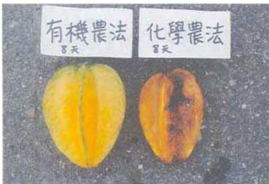
圖五 對照區楊桃果實(右)採收後 8 天即嚴重腐爛，而有機區(左)仍正常。

Fig. 4. The carambola in CK plot showed serious leaf chlorosis and dropping during the winter and spring harvest season.