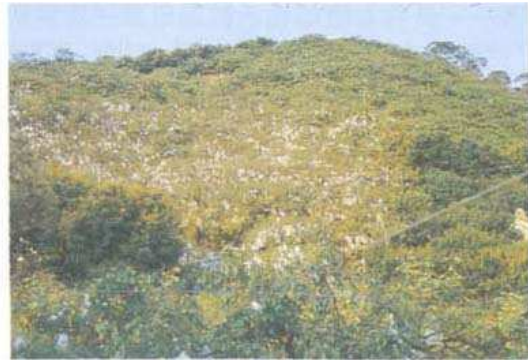
圖四 對照區楊桃到冬春季採收期發生嚴重的黃化與落葉現象。

Fig. 3. The leaves of carambola in organic plot continuously sprayed with the mixture of enzyme-sugar solution and vinegar only slightly turned yellow and no leaf dropping in the winter and spring harvest seasons.