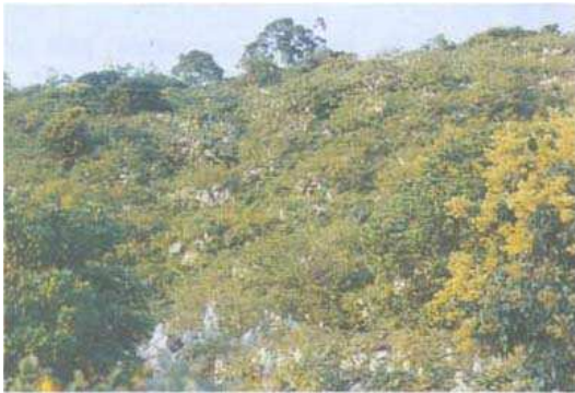
圖三 長期連續噴施糖醋液有機區楊桃到冬春季只有輕度黃化而沒有落葉現象。

Fig. 3. The leaves of carambola in organic plot continuously sprayed with the mixture of enzyme-sugar solution and vinegar only slightly turned yellow and no leaf dropping in the winter and spring harvest seasons.