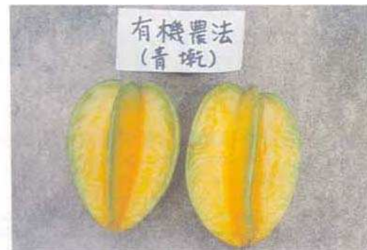
圖六 連續噴施糖醋液有機區楊桃果實光亮而有明顯的綠色果緣。

Fig. 5. The carambola fruit from check plot (right) seriously rotted 8 days after harvest, and that of organic plot (left) is still normal.