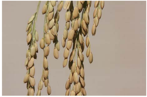
■ 台中193號之無稈毛稻穗